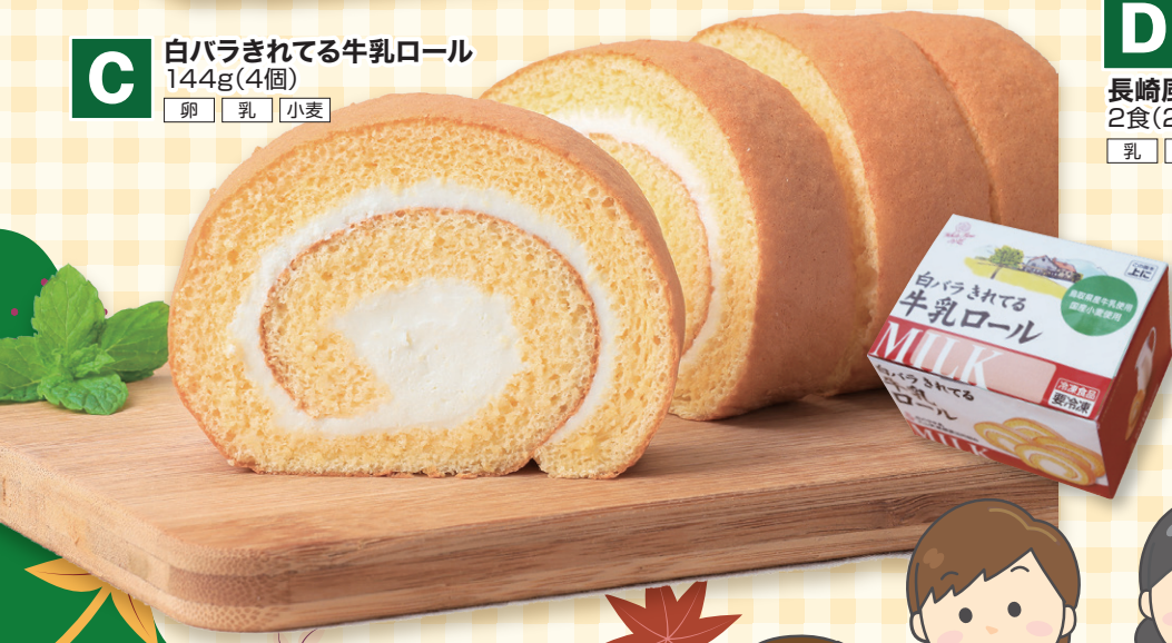
C 白バラきれる牛乳ロール 144g(4個) 卵 乳 小麦