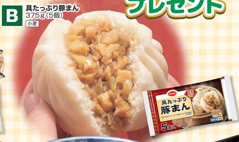
B 具たっぷり豚まん 375g(5個) 小麦