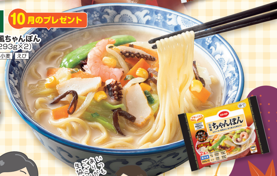
D 10月のプレゼント 長崎風ちゃんぽん 2食(293g×2) 乳 小麦 えび