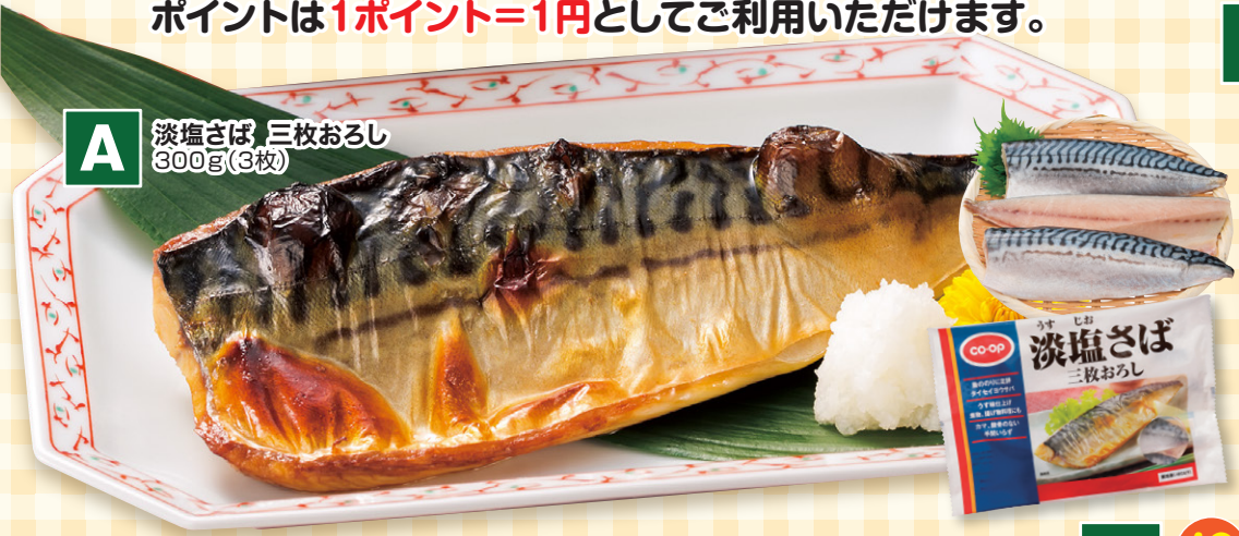
A 淡塩さば 三枚おろし 300g(3枚)